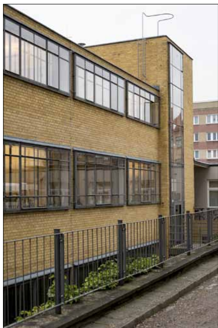
La maison de l'Emploi