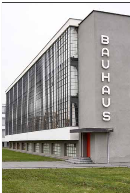
L'emblématique BAUHAUS de Dessau