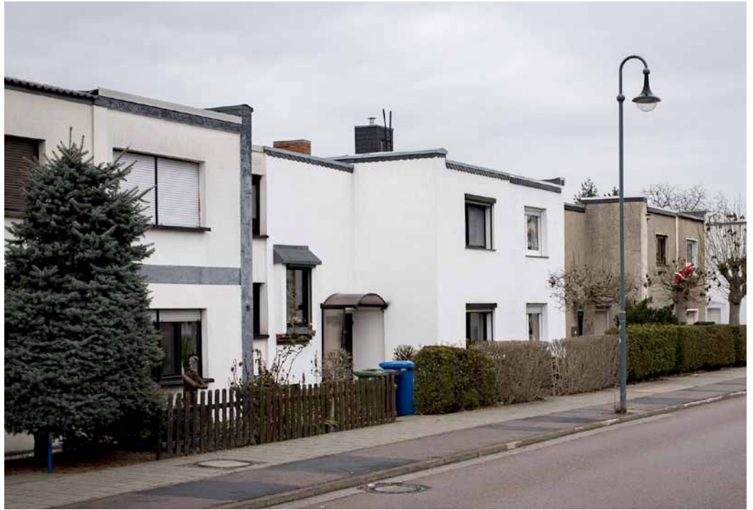
Maisons individuelles en bandes