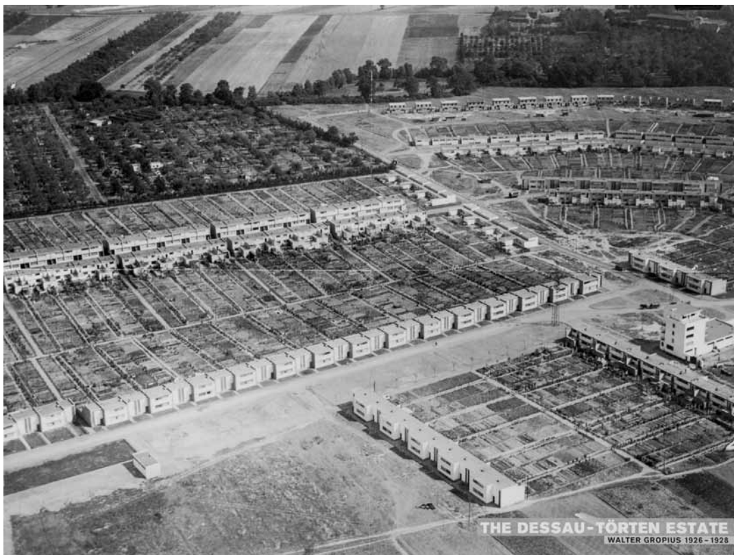
Vue aérienne de la cité Törten