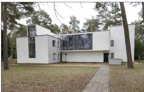
Une des quatre "Maisons des Maîtres"