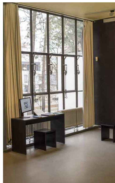
Latelier de KLEE