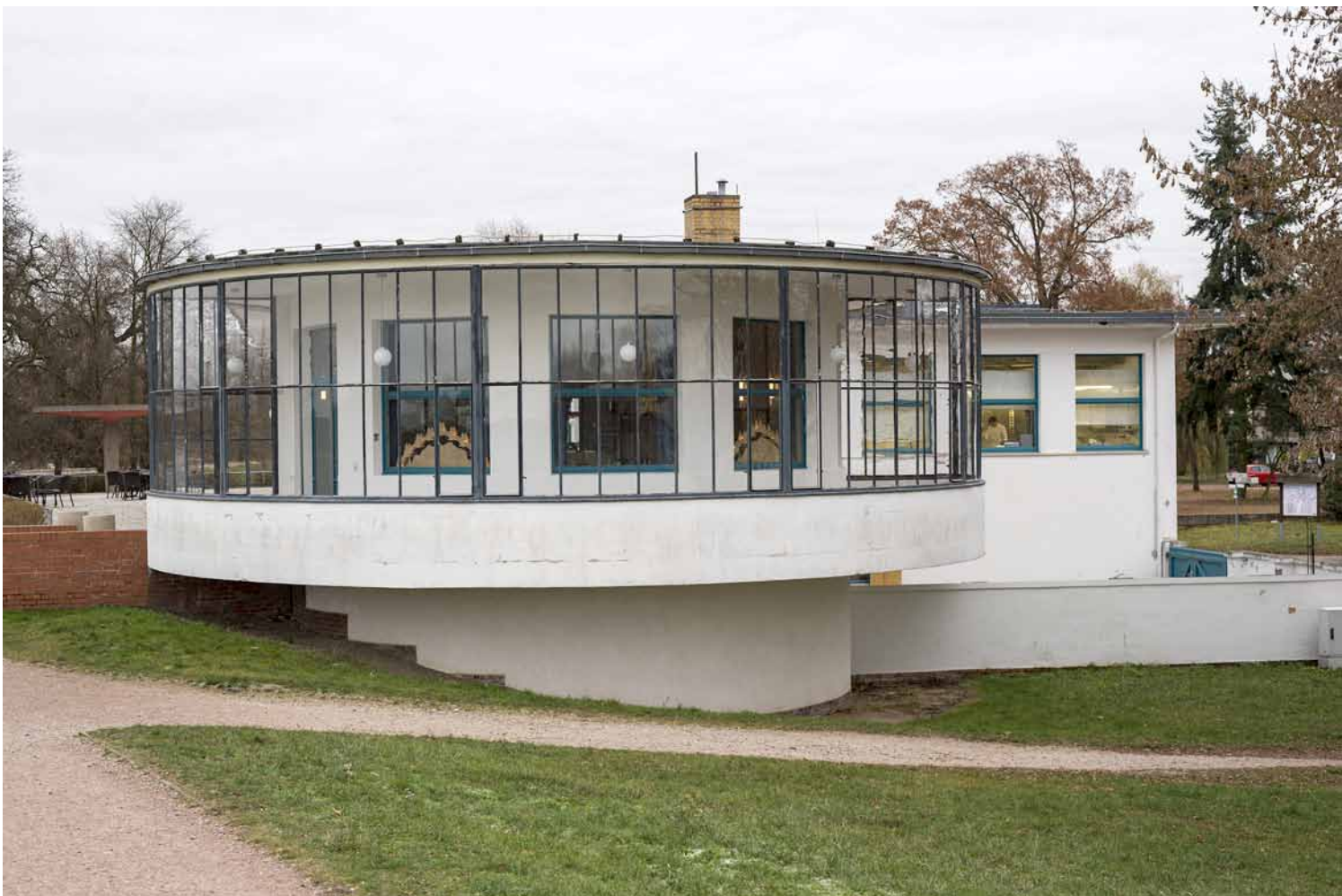
Restaurant "Kornhaus" FIEGER arch.