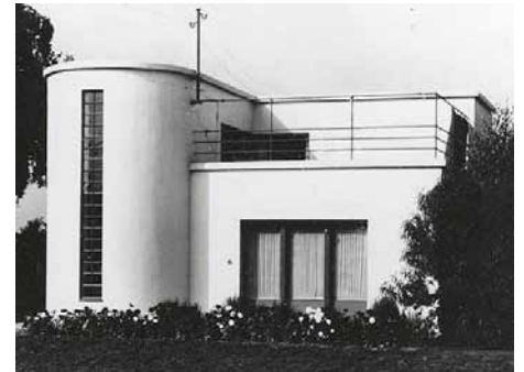
Maison de l'architecte Carl FIEGER