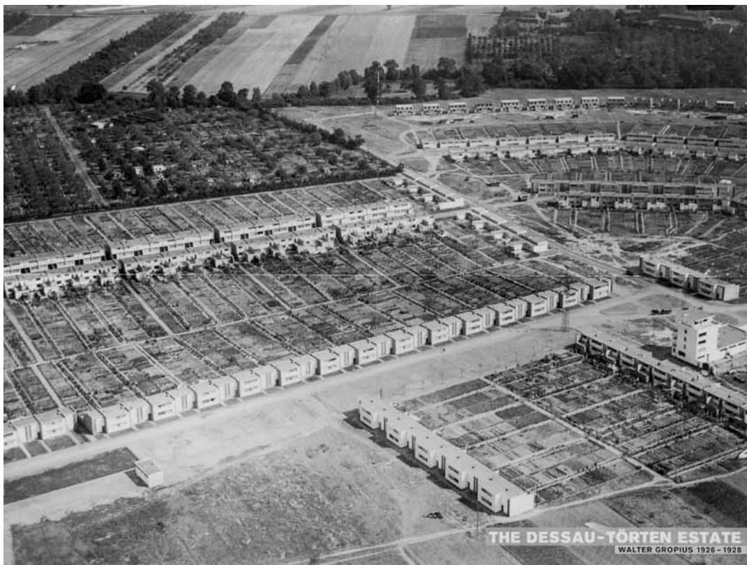
THE DESSAU-TÖRTEN ESTATE WALTER GROPIUS 1926 - 1928